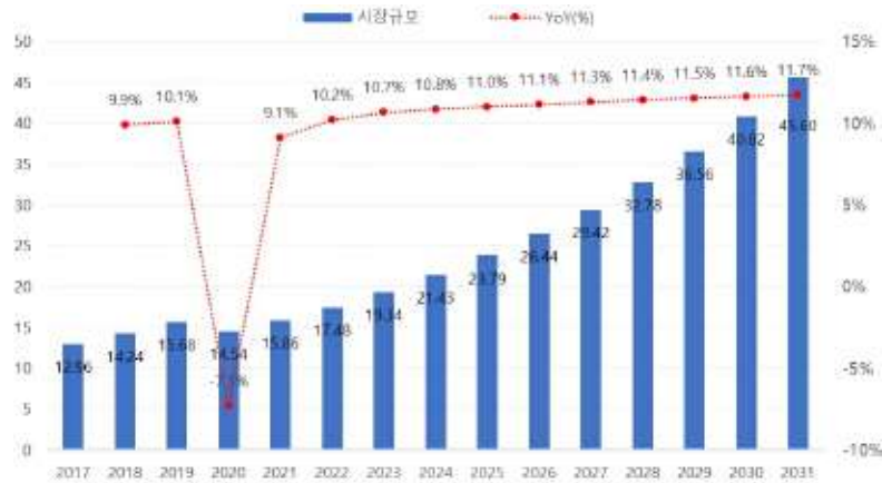
글로벌 프로토타입 시장규모 및 전망

출처 : Global Product Prototyping Market Analysis and Forecast, Transparency Market Research